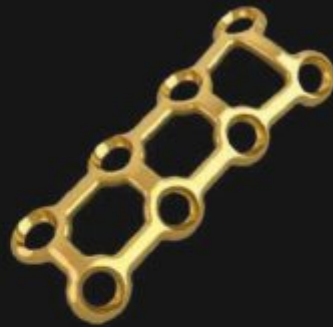
MICRO PLACAS VERSA Ø1.5 MM