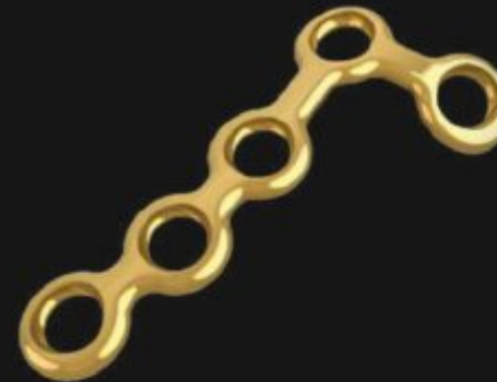
MINI PLACAS VERSA Ø2.0 MM

* Consultar disponibilidade, venda mediante prévia solicitação.