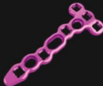
PLACA VERSALOCK T DORSAL

Placas T e L desenvolvidas para o tratamento das: fraturas, osteotomias e pseudoartrose do rádio distal dorsal, com orifícios para parafusos bloqueados de ângulo variável \pm 15^\circ e autocompressão \varnothing 2.4 / 2.7 mm, fabricadas em titânio.