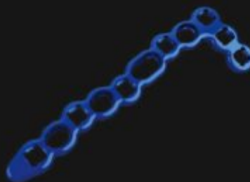
PLACA VERSALOCK L DORSAL